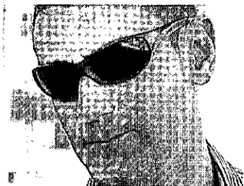
►M. A. Z. R. MOZO DE ALMACÉN

«Es insuficiente para temas como el botellón, pero es demasiada para cuestiones como la ordenanza».