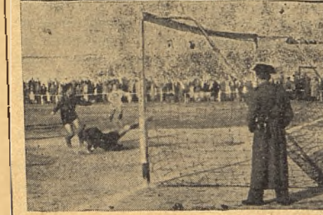
Los tres goles que el Valdepeñas logró el domingo, valiosamente, frente al Extremadura.

se produjo, no había atenuantes de ninguna clase. —¿.....? —Los valdepeñeros han jugado bien. Se ha puesto, en la segunda parte, todo el interés que se ha podido.