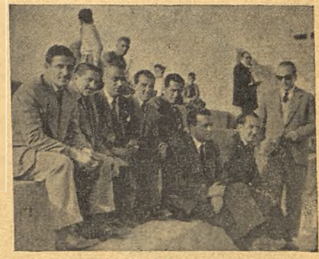
Un grupo de jugadores del Extremadura en el Estadio de Ciudad Real durante el partido de juveniles del sábado pasado. (Foto Angel).

El Extremadura de Almendralejo, tomó su partido contra el Valdepeñas con todas las precauciones. Llegó aquí en la madrugada del sábado y parte de sus jugadores, el entrenador señor Aranda,