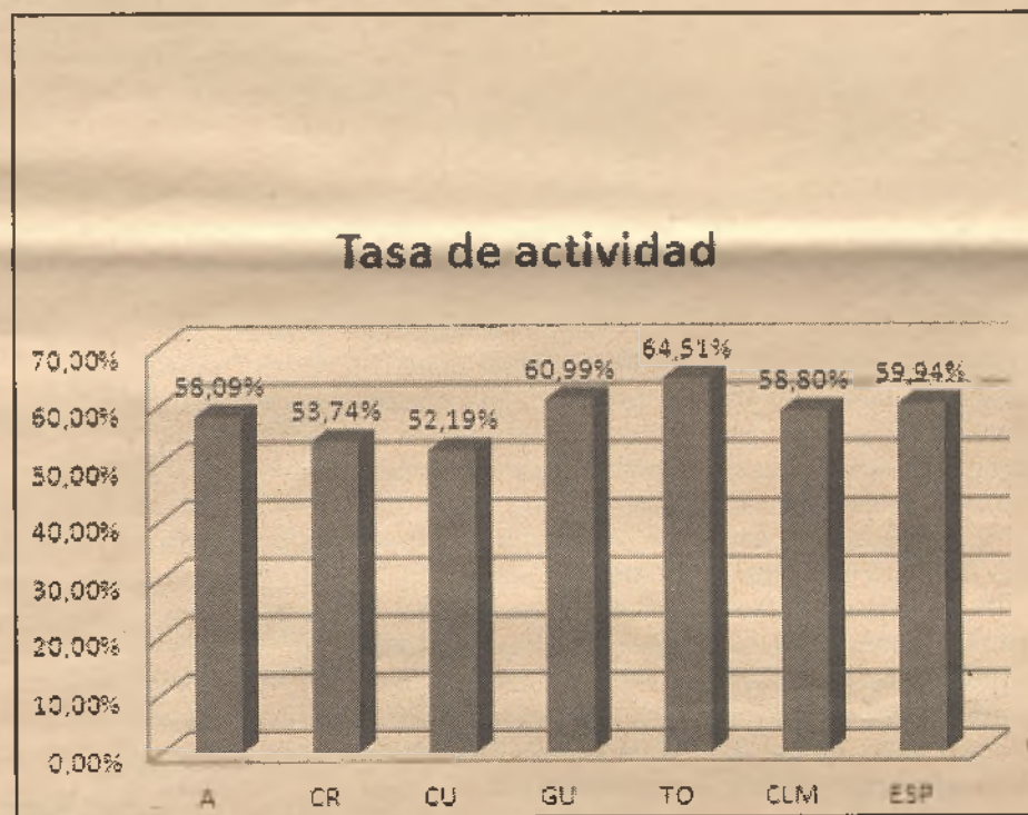
Guadalajara presenta una alta tasa de actividad, sólo por debajo de la de Toledo.

Otro dato alarmante es que los hogares con todos sus miembros en paro ascienden hasta los 1.728.400 en el primer trimestre del año, lo que supone incremento del 9,74% respecto a al cierre de 2011.