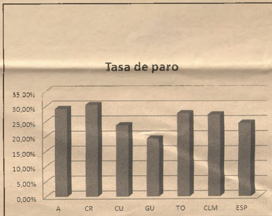
La provincia es la de menor tasa de paro en toda la región.