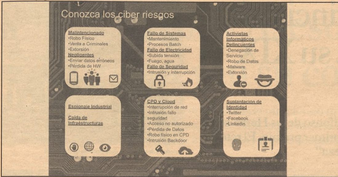
Principales ciber riesgos. / Economía de Guadalajara