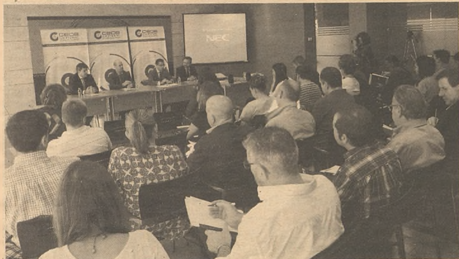
Los empresarios se mostraron muy interesados en las ayudas. / Marta Sanz