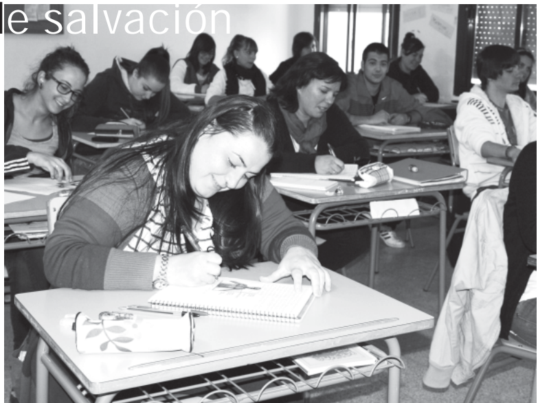
Una clase en la rama de Atención a Personas con Dependencia.

El IES "Modesto Navarro" ha notado mucho este repentino interés por cursar FP. Sólo para la rama de Atención a Personas con Dependencia ha habido más de cien solicitudes. Al final, han entrado 49 alumnos, de los cuales 25 en 1º y 24 en 2º. Ha sido preciso habilitar un aula más, y hay dos para prácticas. Dan clase cuatro profesores. La rama de Sistemas Microinformáticos y Redes cuenta con 40 matrículas, 25 en 1º y el resto en 2º, atendida por cinco profesores. Por último, el ciclo de Gestión Administrativa sólo tiene 5 alumnos en 2º, con dos profesores.