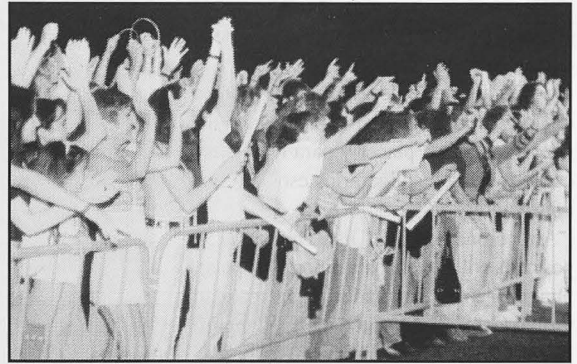
Fans de Sergio Dalma durante su actuación.