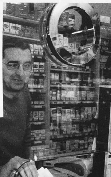
Estanco donde fue validado el boleto del Euromillón.

enero, a razón de 5.000 euros al décimo. Pedro Galindo, popular barman solanero,