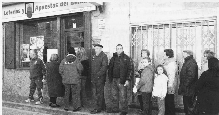
Cientes haciendo cola en la Administración de 'la Nicanora'.