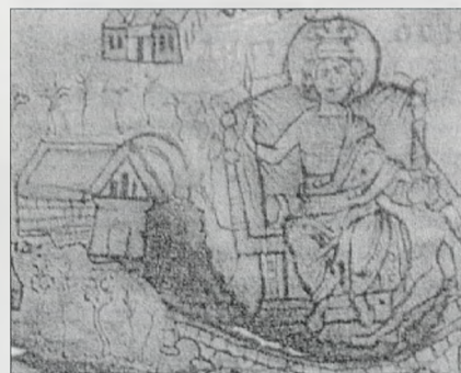
Fig. 8 TABULA PEUTINGERIANA. Imagen de Antioquía, con la personalización que también representa la dignidad imperial. Gran edificio que es el templo de Apolo. Aparece rodeado de unas representaciones de bosque: es el bosque dedicado a Dafne. Uno y otro fueron destruidos por los cristianos en el año 362

En el Norte de África, por el contrario, este horizonte se ha identificado bastante bien en asentamientos civiles y