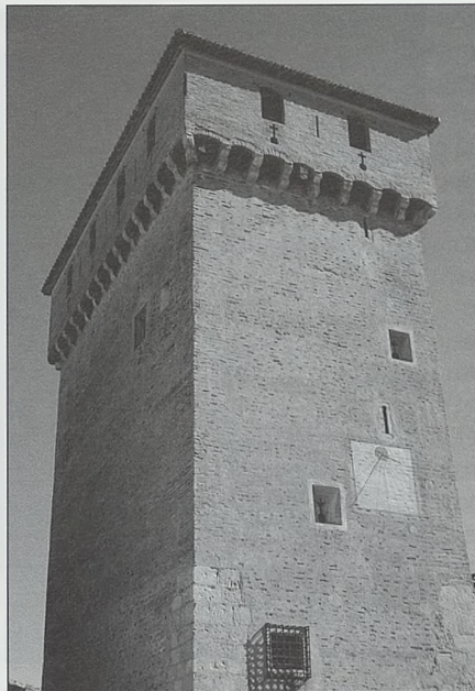
Torre de Benavites

Otrora ejemplo histórico de grandeza, Sagunt hoy