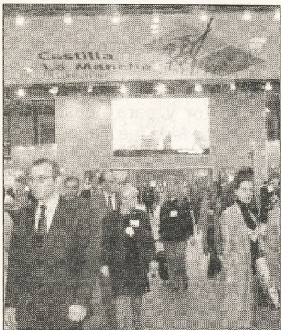
Castilla-La Mancha refuerza las áreas de negocio en Fitur 2004