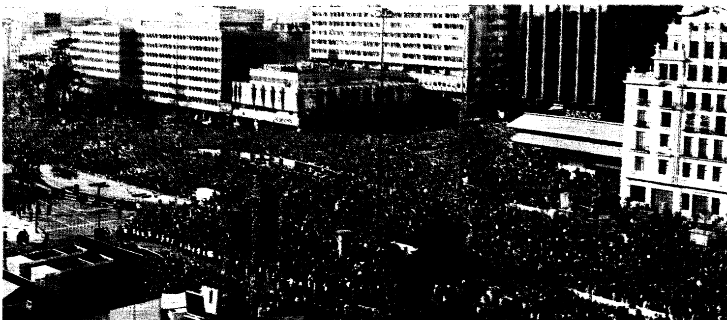
Vista aérea de la Plaza de Colón de Madrid