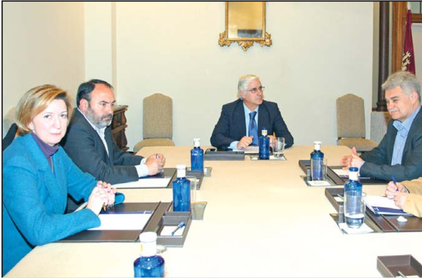
Un momento de la reunión del Gobierno regional con los sindicatos.