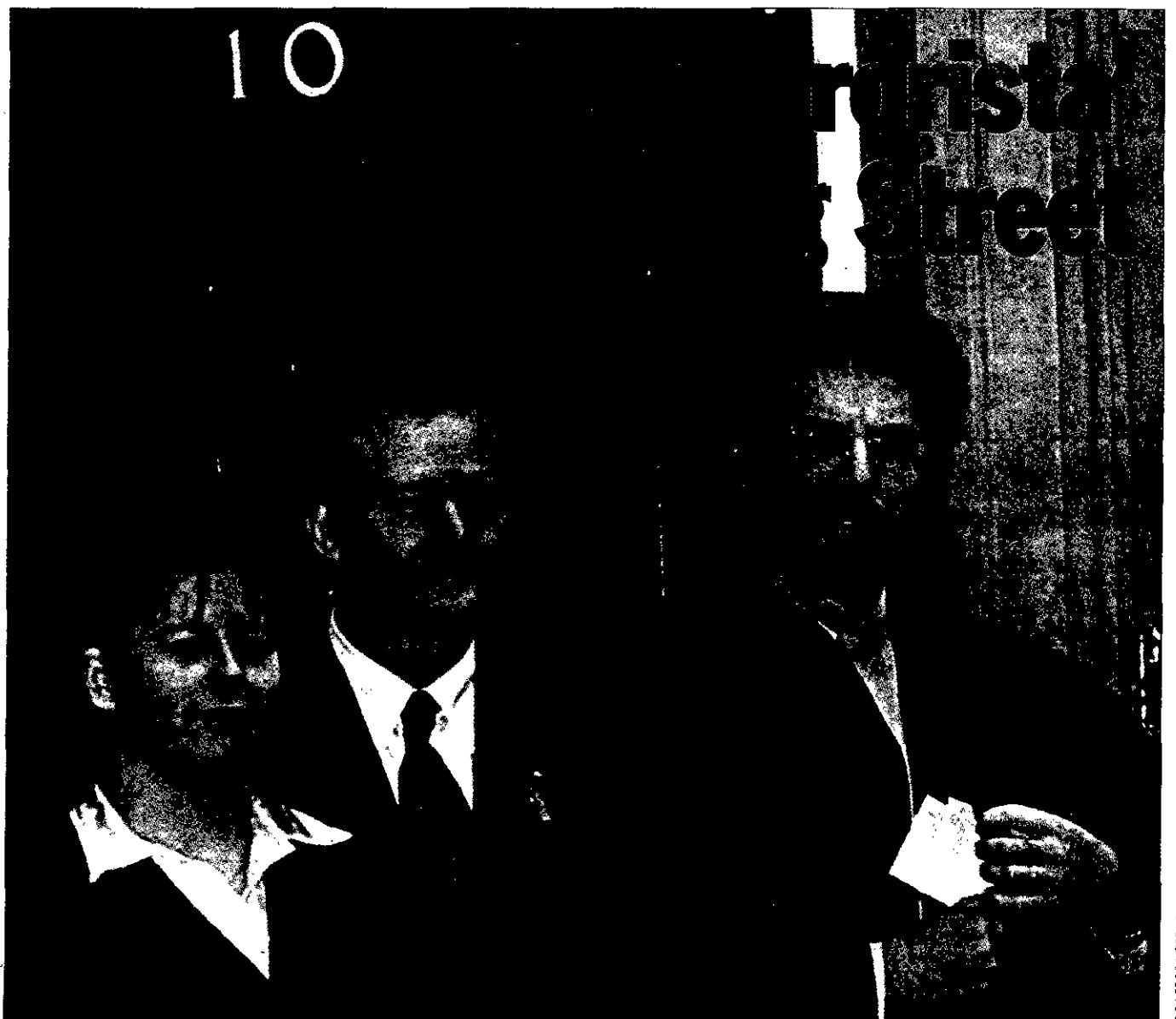
EN EL NÚMERO 10 Gerry Adams (der.), su compañero Martin McGuinness antes de entrar en la residencia del primer ministro británico.

76 años después de que Michael Collins fuera recibido por el liberal Lloyd George, Gerry Adams se entrevistó con el laborista Tony Blair