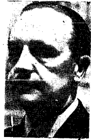
El Ministro Secretario General del Movimiento, camarada Fernández Cuesta.

Afirmo en él que se quiere la utopía exterior contra España, a la que quieren arrastrar ciertos pueblos occidentales, en su afán de crear la inestabilidad económica y el dinamismo perturbador y revolucionario de Rusia, y que los Naciones Unidas van a obligarnos a sacrificar a España no era sino un tributo a grandes objetivos soviéticos. Se ha abierto paso a la utopía de nuestro pueblo cuando se congregó en forma de Franco: burlado a Dios por habernos concebido tal fe en semejante testamento y se dispuso a realizar fuera donde fuera preciso, con esa moral que permitía los españoles en las causas justas y grandes cuando se nos salía fuera. Se refiere a 1918 y señala la diferencia del clima, con lo que por entonces se respiró en España y lo que Franco ahora ha sembrado al mundo la avilón de las posibilidades. Se refiere a la situación económica, los temas sobre producción y distribución de riquezas y los problemas jurídicos de la política y de la justicia social. Concluye diciendo que los salarios, entrecruzados, de todas las fuerzas económicas del país, y trata de las relaciones entre el sector económico, destacan como el marxismo se esforcó al pretender interpretar la historia sobre el esquema teórico del material. Considera error político grave el que se desconociera de sus posibilidades al hombre de Estado y le hace creer que su misión se reduce a obedecer, en vez de orientar y ensayar las aspiraciones del pueblo.