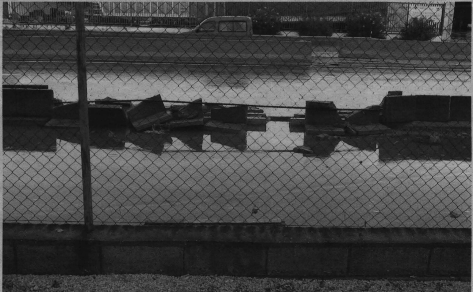
La tromba de agua, que se prolongó entre las 10 y las 11 de la mañana, anegó zonas de Valdepeñas, como la A-4 a su paso por la localidad del vino. Protección Civil estuvo alerta durante todo el día de ayer ante la previsión de precipitaciones abundantes en la comarca de La Mancha y en la de los Montes de Toledo.

Las amenazas obligan a evacuar varios institutos en Finlandia