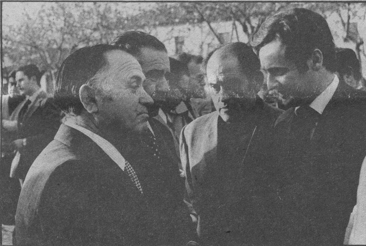
El alcalde don Rafael Guijarro y demás componentes de la Corporación con el gobernador civil señor López del Hierro.

● El Gobernador Civil con otras autoridades asistió a esta importante inauguración.