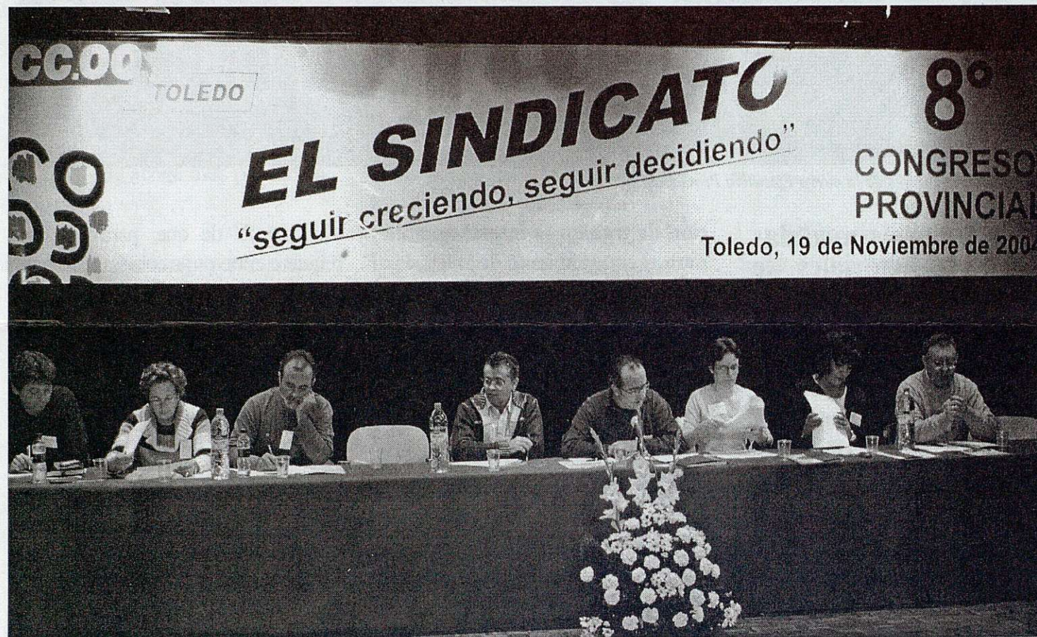
Mesa presidencial del 8º Congreso