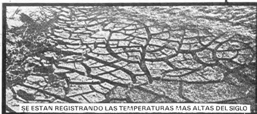
SE ESTAN REGISTRANDO LAS TEMPERATURAS MAS ALTAS DEL SIGLO