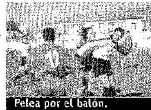
Pelea por el balón.

Andalucía y el norte de la Península han sido los destinos preferidos por los conqueses para pasar el puente de la Constitución según la información facilitada por diversas agencias de viaje de la ciudad,