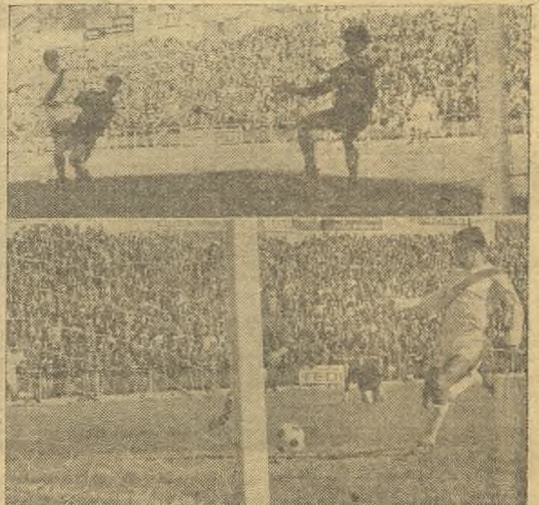
El Rayo volvió por sus fueros de goleador. Arriba, el tercer gol del partido contra el Osasuna. Abajo, gol de Grande, el quinto, que remacha Aráez. De la gran jornada en Vallecas, crónica en la página tercera.