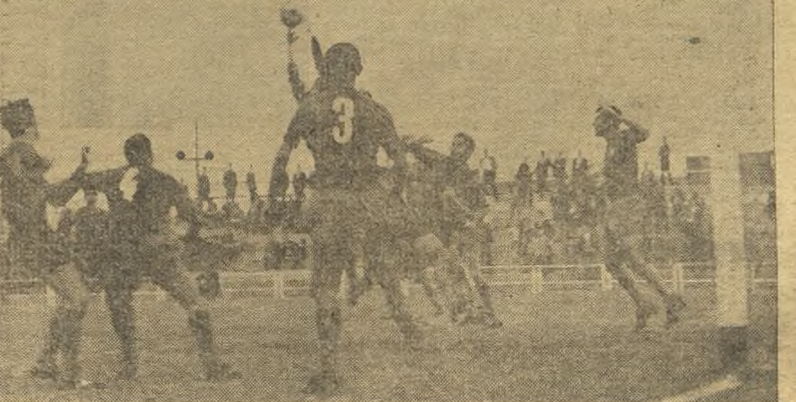
Los penaltys también cuentan. Y cuentan, porque, como en el caso del Caño Solís, vinieron como consecuencia de jugadas que eran gol, al menos el segundo. En la foto de Rueda, un acoso local, salvado por la poblada defensa del Jerez. (Amplia información en tercera página).