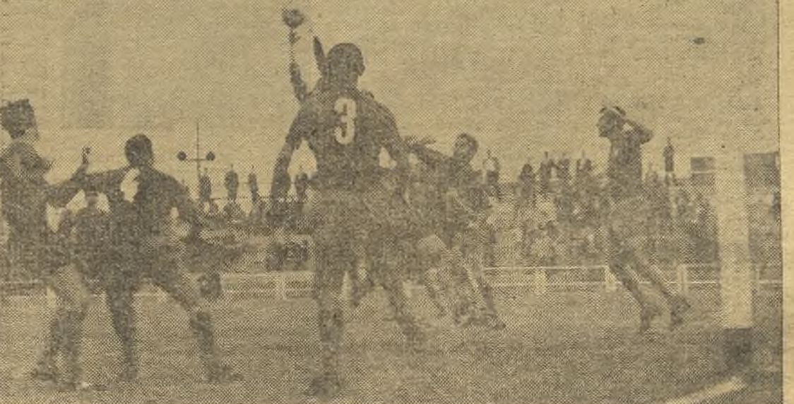
Los penaltys también cuentan. Y cuentan, porque, como en el caso del Caño Solís, vinieron como consecuencia de jugadas que eran gol, al menos el segundo. En la foto de Rueda, un acoso local, salvado por la poblada defensa del Jerez. (Amplia información en tercera página)