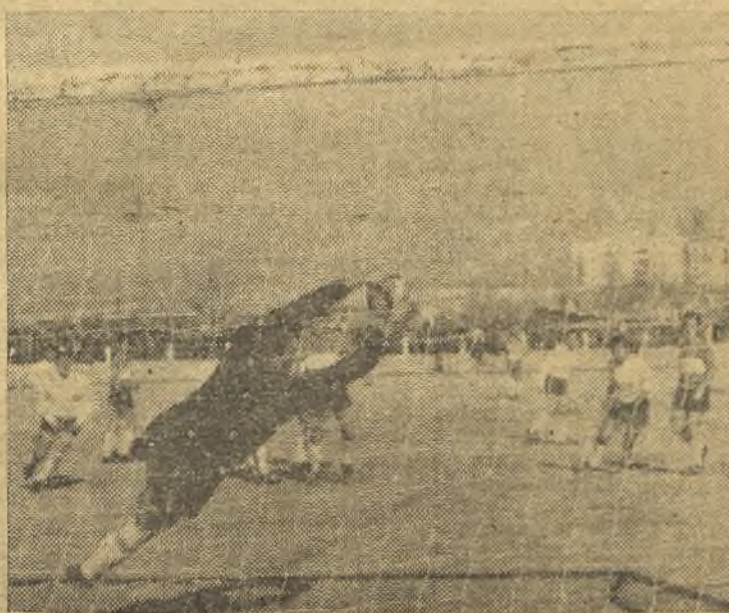
Navas tuvo una buena actuación. Aquí se vemos haciendo una gran parada. Sin embargo, el Carabanchel no pudo con el Boetticher. (Foto Angel). (Información en la página 12)