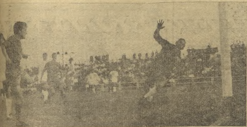
Siete goles, siete, en Puertollano, cuatro para los locales y tres para los visitantes. La foto de arriba muestra el momento en que el jugador local, a última hora, puso en apuros al C. Sotelo. En la foto de abajo, el primer gol del Calvo Sotelo. (Información en la página tercera)