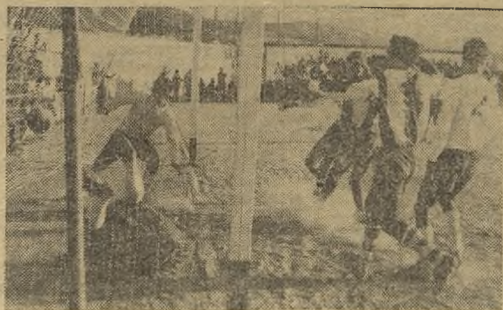
El Plasencia ganó por la mínima ante un duro Boctlicher. Este es el segundo gol local, marcado un poco a trompicones y ayudado por el interior derecho visitante, en una melée. (Foto Medina). (Información en página doce)

...que en Zaragoza se quejan de que, Cortizo, ese defensa durillo del Jaén, a quien los negocios llevaron a la capital del Santo Reino, haya dicho que los directivos zaragozistas no le apoyaron cuando su sanción. El presidente estuvo a punto de ser expedientado por defenderle y el Zaragoza aparte de pagarle su sueldo, lo alineó en todos los partidos internacionales, para que ganase las "primas" correspondientes.