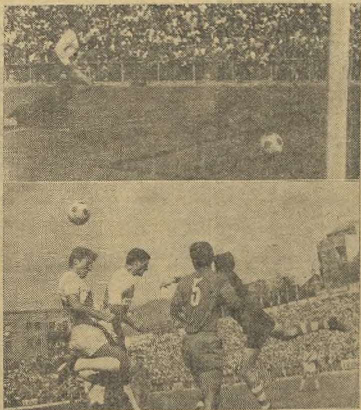
Los "celtas" no han sido nunca malos. El domingo ardieron en Vallecas y ardieron bien, aunque el Rayo hizo méritos para haber ganado, pero el fútbol es así. En las fotos de Balaguer, arriba, el gol del Rayo; abajo, el portero céltico a la espeja de puño ante un ataque rayista. (Información en tercera página)