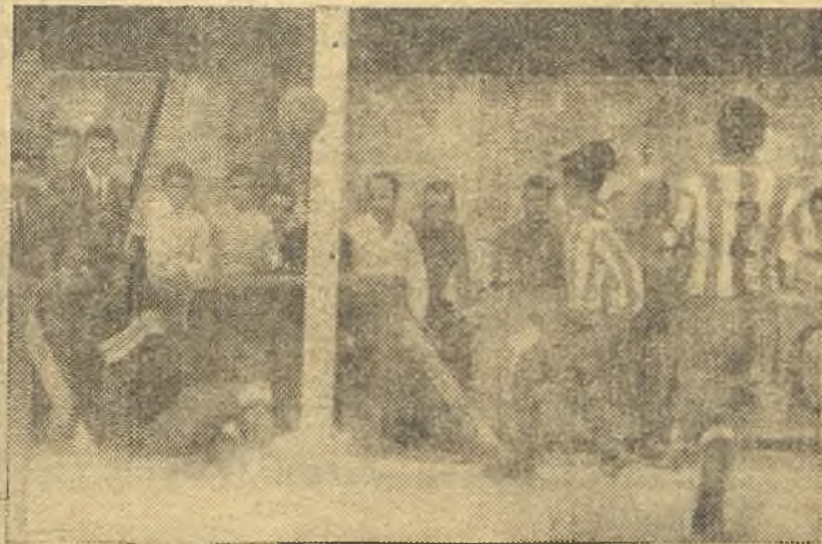
Una de los goles del Reyfra, que no pudo evitar la defensa del Atlético Calvo Sotelo, en Getafe. Buen partido con triunfo mínimo local. (Foto Campillo). (Información en página trece)