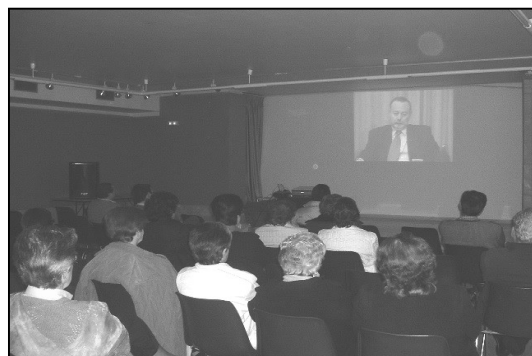
Un momento del Video-Conferencia

Por eso los temas tratados, « ¿Cómo prevenir el abuso del alcohol » y « ¿Cómo tratar esta enfermedad? », fueron dirigidos especialmente a la familia y más concretamente a los padres.