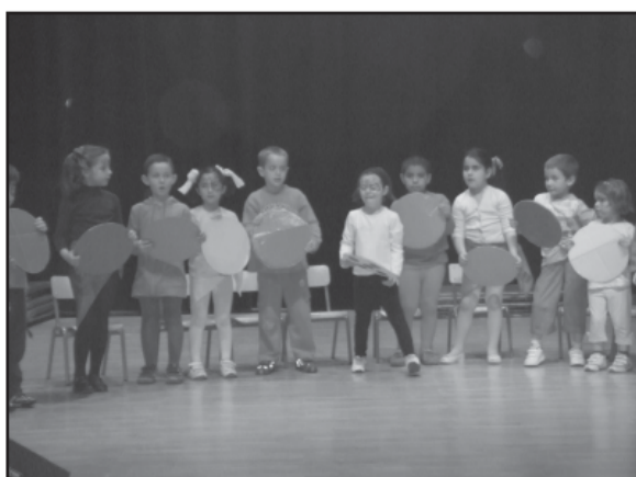
Actuación de los niños de la Ludoteca Municipal

El pasado 29 de abril se celebró en el Auditorio una nueva edición de la Operación Enlace de Manos Unidas, organizada por el instituto y la parroquia de Yeste. Fueron dos horas de espectáculo con las que jóvenes de todas las edades pusieron algo de su tiempo, su esfuerzo y solidaridad para ayudar a un proyecto de ampliación de una escuela en la India.