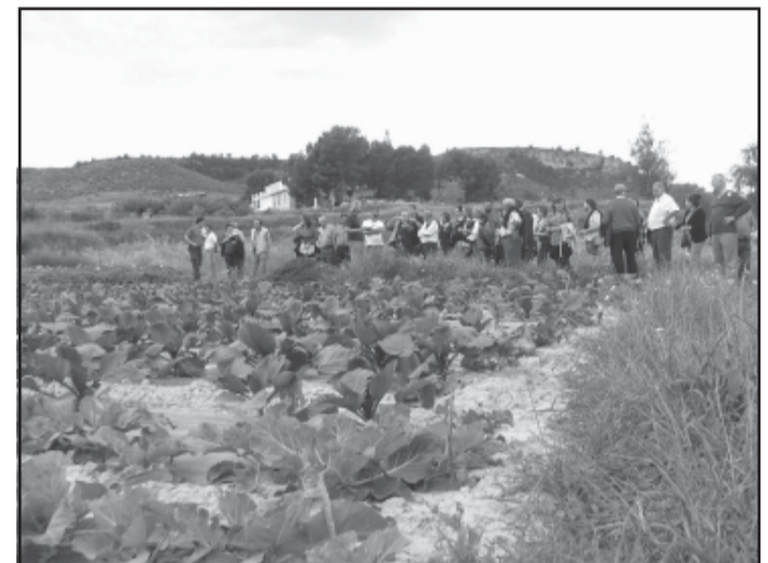
Los vecinos de Yeste visitando una de las plantaciones