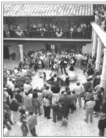
Grupo «Aire Serrano» de Yeste