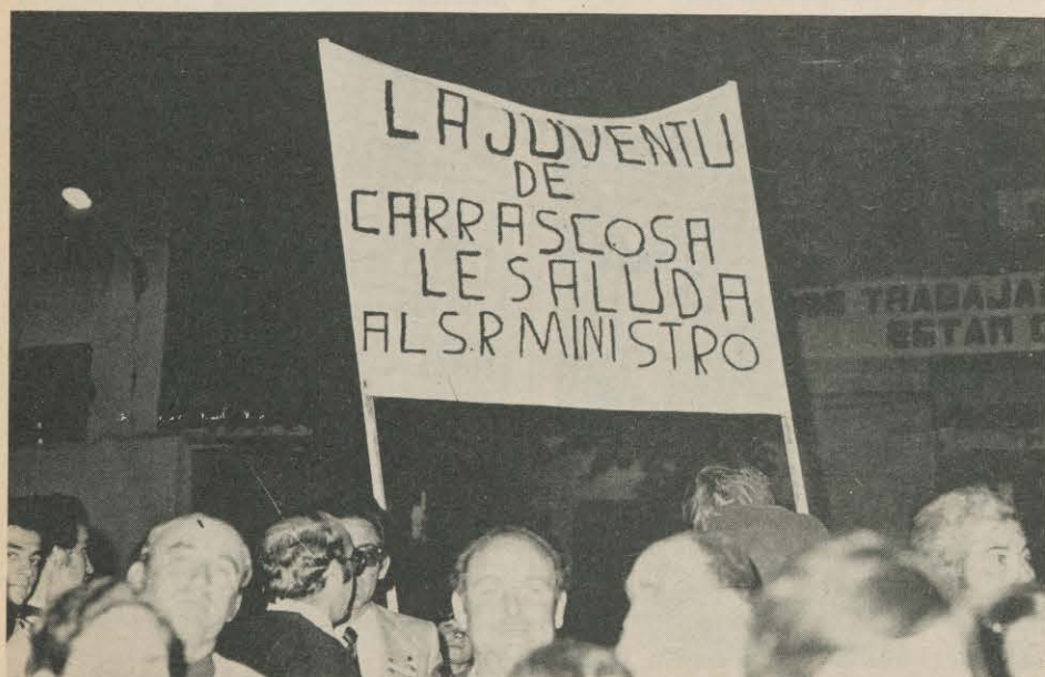
TAMBIEN LA JUVENTU ESTUVO CON EL MINISTRO

Son los problemas que da el escuchar la BBC. ●