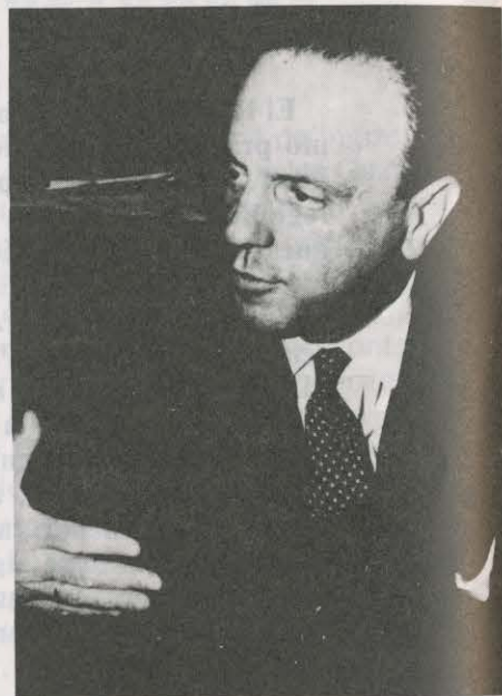
FRAGA: REGIONALIZAR DESDE ABAJO

fluencia que comprende por igual las provincias de Alicante, Castellón y Valencia, es inminente”. Realizará, en principio, las siguientes actividades: cursos para secretarios de Administración local; cursos para periodistas de la Región valenciana; cursos para