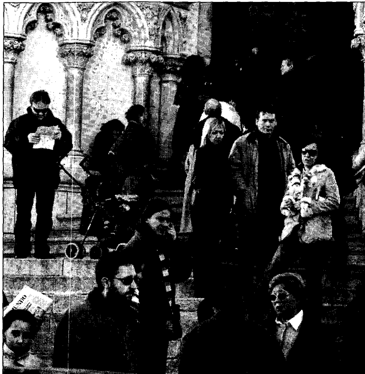
Divergencias en el diagnóstico del comportamiento del sector.

También arrojan resultados positivos las estimaciones, aun-