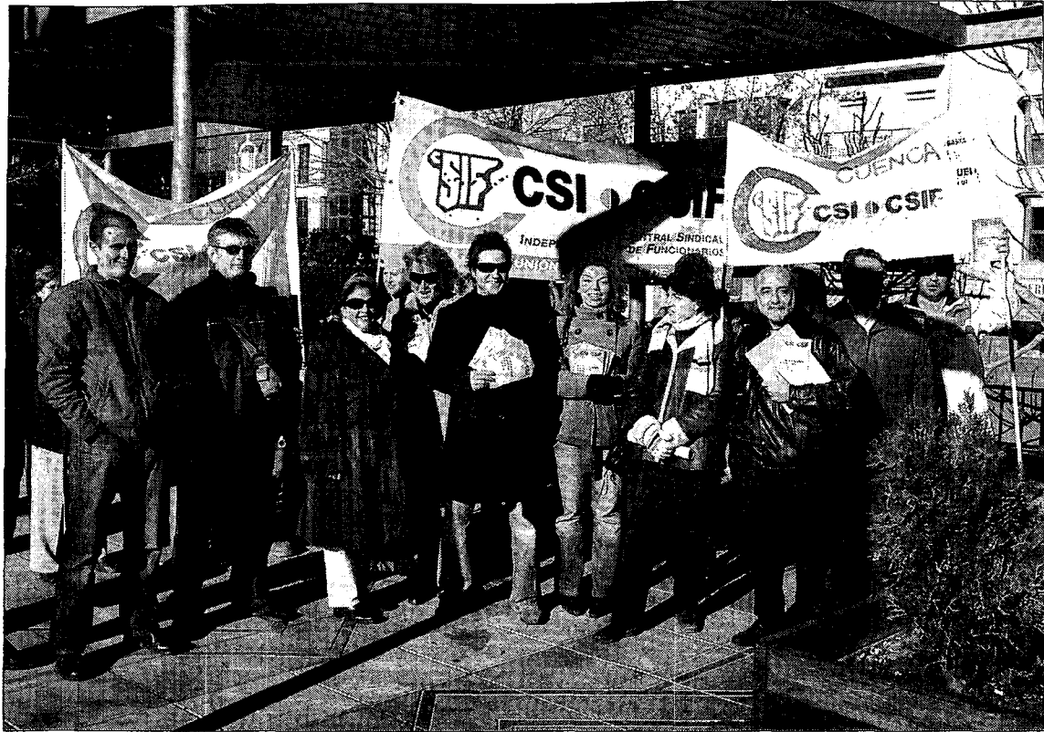
Algunos de los concentrados, ayer, en la Plaza de España.

Huelga en el sector de Correos. El sindicato UGT y el Sindicato Libre informarán hoy a las 11.30 horas en una rueda de prensa sobre la convocatoria de la huelga estatal en el sector de Correos prevista para los días 19, 20 y 21 de este mes.