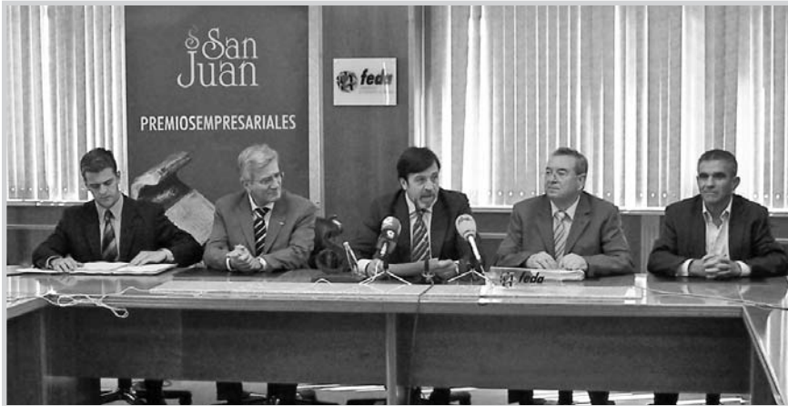
Un momento de la presentación de los Premios Empresariales San Juan 2006.

Los premios San Juan también reconocen a la Semana Santa de Hellín y la expedición al Everest