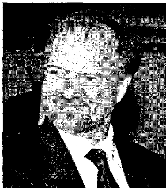
EL ENEMIGO Robin Cook, canciller del británico Foreign Office.

Tras su 'retirada' en la OTAN, Londres no cederá en nada