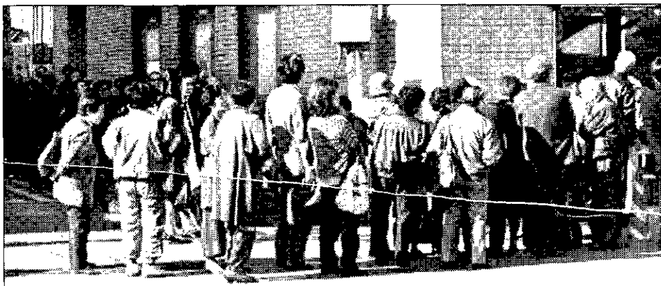
RECUPERAR EL DINERO Cientos de japoneses hacían ayer cola ante el banco quebrado para recuperar sus ahorros.

otra entidad japonesa, o por una nueva crisis en otro país del sudeste asiático. Los recales se centran ahora en Corea.