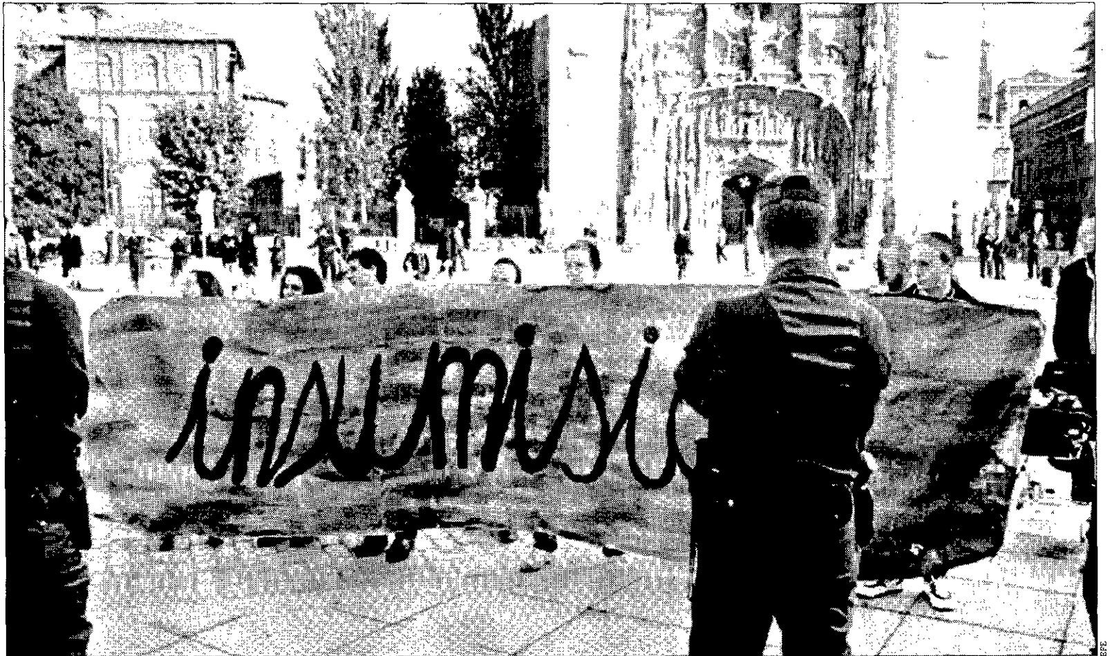
INSUMISIÓN Un grupo de jóvenes del Movimiento de Objeción de Conciencia de Valladolid, protestaron contra el sorteo de excedentes de cupo del miércoles.