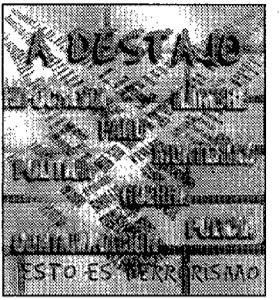
Portada del CD.

presentarán su último disco "Una Semana en el Motor de un Autobús", en primicia en Guadalajara. El cartel lo completan "Lagartija Nick", "B-Violet", los argentinos "Suárez" y los alcarreños "Killing Sue" y "Los Notas". Además, la organización ha tenido que trabajar intensamente para encontrar sustituto a "Pribata Idaho", grupo que ha renunciado a su participación, a última hora, incumpliendo el contrato firmado. La nueva formación serán los holandeses "Big Paulus".