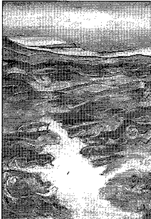
Pinturas de Juan Ignacio Murillo, en la Diputación Provincial.

tas: de 20 a 22 h. Sábados, de 19 a 21 h. (excepto domingos y festivos).