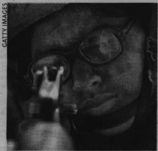
Un marine con un rifle. Estados Unidos acaparó el 45% del gasto mundial en armas.