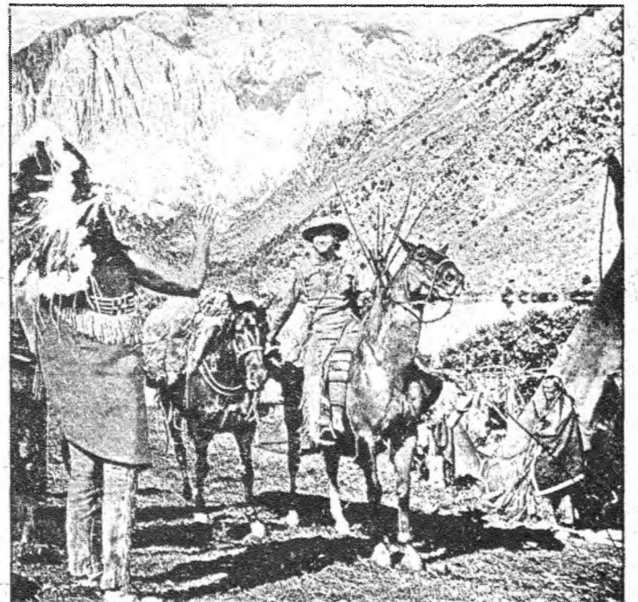
Fotograma de "La Conquista del Oeste" película que surgió de una idea publicada en la revista Life y que pueden ver en el cine Rojas días 1-4 de agosto.

ron el Oeste masacraron al pueblo indio para arrebatarle sus territorios.