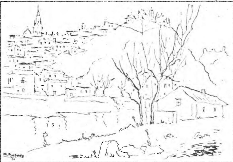
Un bello dibujo de Pintado que muestra la perspectiva de la barriada de Antequeruela-Covachuelas.

• La recaudación de los festejos ha cubierto los gastos de organización