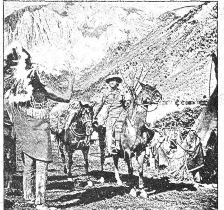
Fotograma de "La Conquista del Oeste" película que surgió de una idea publicada en la revista Life y que pueden ver en el cine Rojas días 1-4 de agosto.

ron el Oeste masacraron al pueblo indio para arrebatarle sus territorios.