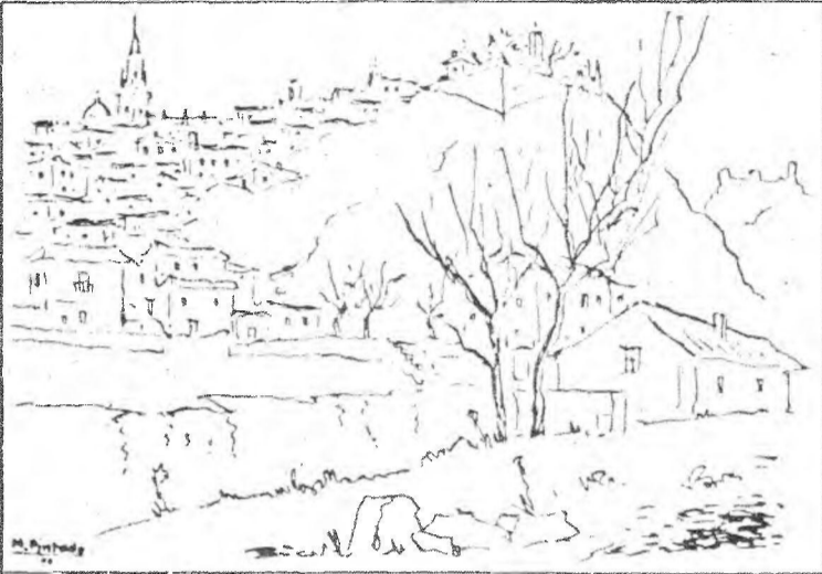
Un bello dibujo de Pintado que muestra la perspectiva de la barriada de Antequeruela-Covachuelas.

• La recaudación de los festejos ha cubierto los gastos de organización