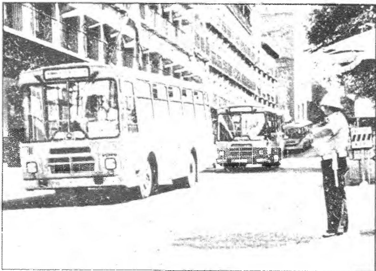
Las paradas utilizadas por los autobuses urbanos son el centro de la polémica suscitada entre el Ayuntamiento y las empresas de autobuses de línea

parada en el casco urbano, a excepción de las efectuadas en la estación de autobuses. A consecuencia de esta medida municipal los transportistas de viajeros por carretera se manifestaron en contra, alegando para ello el perjuicio que se causaría a una gran parte de los viajeros y, de una manera predominante, a aquellos enfermos que hacían la parada en la Residencia Sanitaria. Por otro lado, los taxistas, como integrantes del transporte urbano, llevaban ya algún tiempo descontentos con las paradas en el casco de la ciudad de los autobuses de línea, por considerar que esta circunstancia pudiera perjudicarles en sus beneficios.