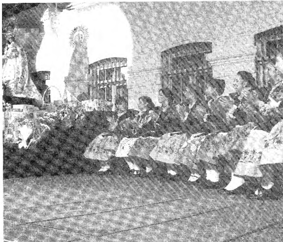
Madrinas de la Feria 2007 en un momento de la Fiesta de la Vendimia.