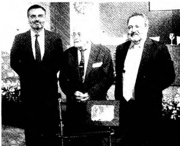
Empresarios distinguidos con la medalla de oro.