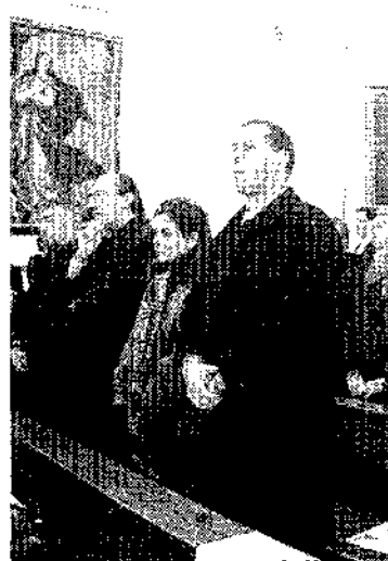
Público asistente a la misa en el Convento de las MM. Justinianas.