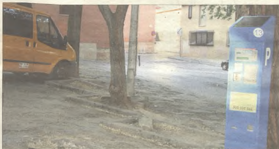
Estado actual de la plaza de Dávalos, tras muchos años precisando un arreglo.