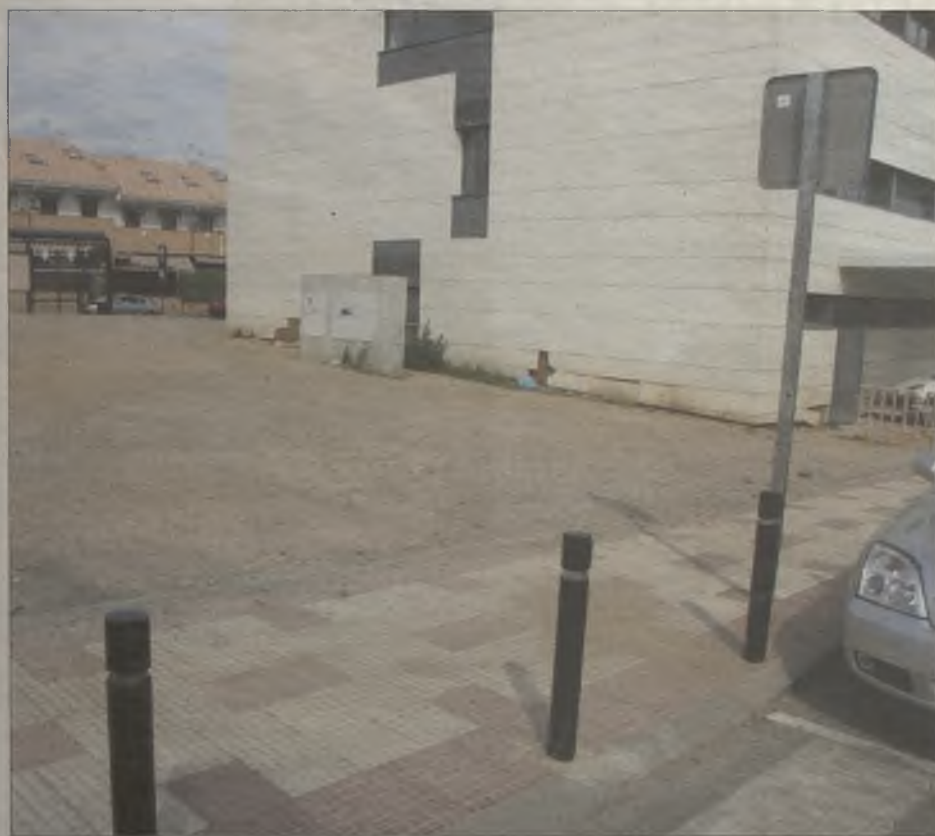
Bolardos instalados por el Ayuntamiento para impedir aparcar junto al centro de salud.