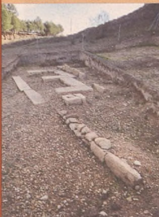
Restos de la necrópolis ibérica

Uno de los problemas que actualmente tiene el Tolmo reside en su condición de propiedad privada, lo que redunda en el coste mayor de las actuaciones y en la ralentización de la toma de decisiones.