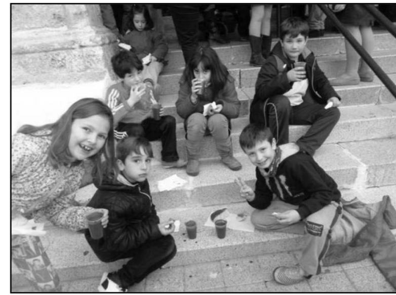
La presencia de los niños alegra y anima las actividades de la comunidad parroquial. Aquí les vemos colaborando en la Campaña de Manos Unidas con su chocolate.

En estos últimos meses, dentro de la actividad habitual de la parroquia, hemos tenido algunos momentos más especiales, tanto por su novedad como por su contenido. En primer lugar, el viernes, 26 de febrero , realizamos una actividad solidaria para apoyar la Campaña de Manos Unidas de este año. A propuesta del grupo de Cáritas y con la colaboración de catequistas y monitores de poscomuniión organizamos una tarde de encuentro de niños, familias y personas de la parroquia en torno al lema de la campaña de este año: “Plántale cara al hambre. Siembra” . Primero realizamos una gimkhana con los chavales de catequesis que representaba un viaje por los cinco continentes, en cada uno realizaban una prueba e iban componiendo un mapamundi con la frase del lema. Mientras en el salón parroquial hicimos una dinámica de reflexión con algunos padres, madres y jóvenes. Después celebramos la Eucaristía, que contó con una gran participación de niños y mayores. Terminamos con un chocolate con torta a un módico precio de un euro más la voluntad. Lo recaudado se ha destinado al proyecto de Manos Unidas de este año: la construcción de una escuela para la escolarización de niñas en la India. Una tarde estupenda a repetir el próximo año.