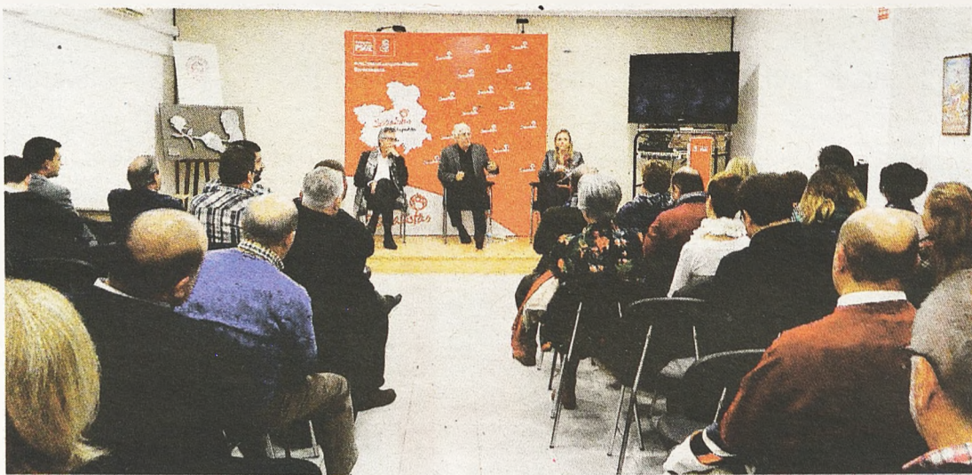
Acto público informativo en la Casa del Pueblo

Asamblea informativa sobre los Presupuestos Generales del Estado