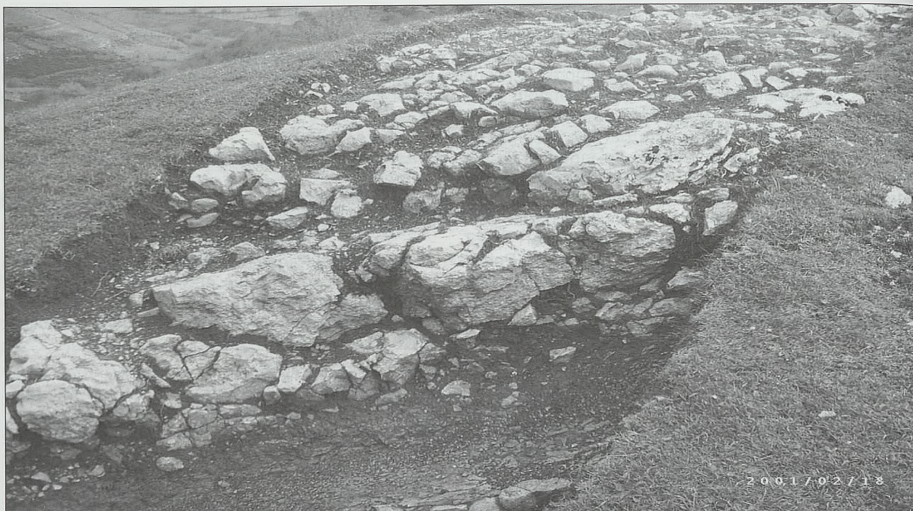
Celada Merlantes. Detalle del cimientto de la muralla