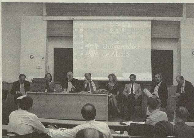
Mesa redonda del curso en la que participan los organizadores de la AEAC y de la Universidad de Alcalá, así como diversos ponentes y propietarios de castillos

El Presidente de la AEAC destacó la importancia de poder reunir a un número notable, llegados de toda España, de propietarios, estudiosos y amantes de castillos y la posibilidad de compartir sus experiencias y soluciones así como problemas que se les plantean, dentro del marco universitario y dar la posibilidad a que sean conocidos por futuros profesionales en disciplinas relacionadas con el Patrimonio Histórico. Para ello recordó la situación legal de los castillos con la declaración de Bien de Interés Cultural en la Ley de Patrimonio Histórico Español de 1985, incorporando el "interés